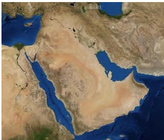
Рисунок к заданию 4 – Самый крупный полуостров мира

На космическом снимке представлен самый крупный по площади полуостров мира. Определите этот полуостров и ответьте на вопросы в таблице.